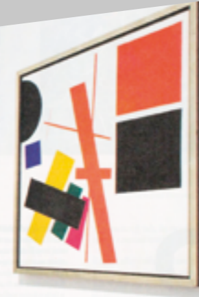
Kazimir Malevič Suprematismus, 1915 olej, plátno

Výstavu Ruské avantgardy jsme přihlásili do národní soutěže Gloria musaealis v kategorii Muzejní výstava roku 2021. ➔